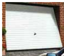
Portes de garage